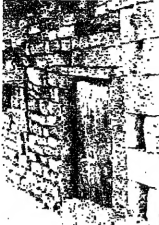
في هذا المنزل ولد القديس شربل

طرابلس - من مكتب «الاتوار» : الذين لا تسبح لهم تفروهم بالسفر الي روما ، لحضور احتفالات تكريم الطوباهي شربل قديساً ، يحجون الي مسقط رأسه يقيمون كفنرا ، والبلدة الرابضة بدمعوتوه ، في جوار قديسنا وعلى سفح ارض الرب في شمال لبنان . قديسنا جدهم الذين سموهم بهذه الالفة ، واهاليها لا يستقرون لكه .. يقولون ان هذا هو قديسنا .. ان تكون منسية من الدولة .. وان تصيح محط انظار الناس ، كل الناس ، الذين يتقانون اليها للكرامة ، والزيارة مهد القديس شربل مخلوف ، ومرتجع سبأ . تتميز بقاع كفنرا بطابعين : الاول انها اعلى قرية في لبنان ، إذ يزيد ارتفاعها ١٧٥٠ متراً عن سطح البحر ، وتبعد عن بيروت ١٢٠ كلم ، ويبلغ عدد سكانها ستة آلاف نسمة . ويزيد هذا العدد عندما يعود اليها ابتداء المهاجرين ، والقسوس من استراليا والكويت والولايات المتحدة . والبلدة التي ولد فيها القديس شربل والبلدة التي ولد فيها القديس شربل وشبابها ترحلها بالدرجة الاولى على الزراعة ، فهي تنتج الكثير من مئتي الف متونة فلاح ، من اكثر من ريوه انقضاءه من حيث استهلاك شهر من اسبوعين تقريباً بدون ان تسرك جشاح حيث تمطيها بقية الوقت . هذا الوقت الذي تخصصه للبنان البقية على الصحة ؟